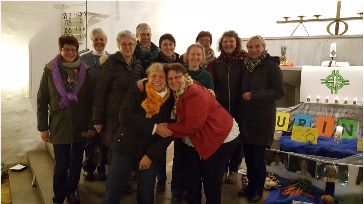
Text und Bild: Ulrike Köberlein